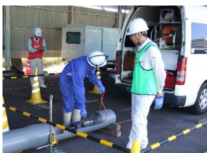
調査部門実技試験状況