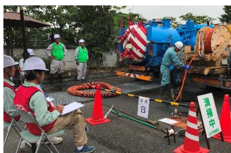
清掃部門実技試験状況